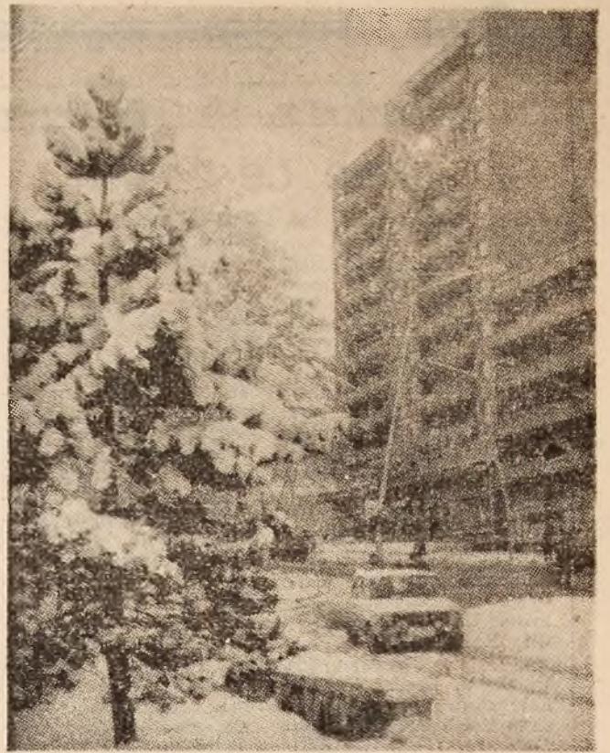
Reședința municipiului în străiele zăpezii