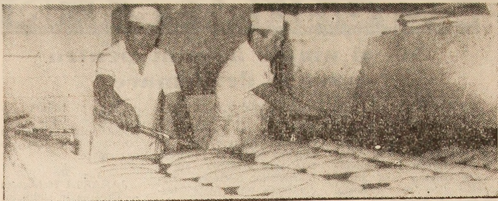
Fabrica de pâine din Lupeni, în plină activitate.