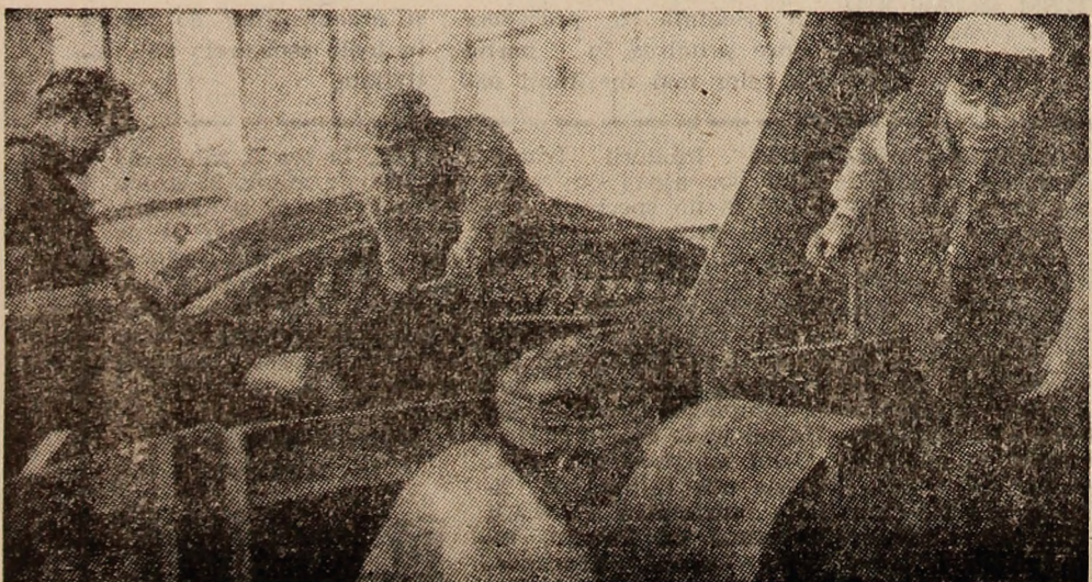
Se lucrează la Trommel-concasorul de la I.M. Uricani.