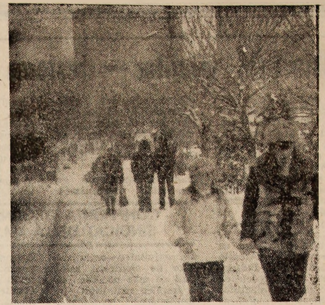
Vulcanul, în plină iarnă.