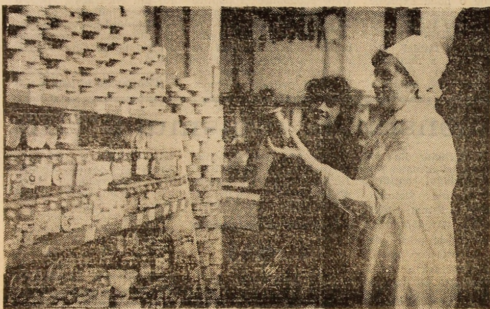
Unitatea cu autoservire nr. 277 situată în cartierul „Viscoza” din orașul Lupeni, este una dintre unitățile cu servire exemplară în cadrul I.C.S. Mixtă Lupeni.