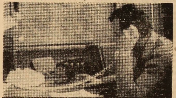
La stația telegrazimetrică a minei Lonea, modernele instalații creează condițiile asigurării respectării normelor de protecție a muncii la fiecare loc de muncă din subteran.

— Cu sprijinul nemijlocit al școlilor, în toate localitățile municipiului nostru vor fi prezentate spectacole tematice pentru copii și șoimi ai patriei. În mod deosebit, recomandăm manifestările care vor avea loc sub genericul „Soare pentru toți copiii lumii” pe scena Casei de cultură din Petroșani, în 26 mai și în 29 mai la Casa de copii din Uricani. La Petroșani, spectacolul va fi susținut de formații calificate în actuala ediție a Festivalului național „Cîntarea României”, reprezentând mai multe școli din localitate, iar la Uricani de către formații ale școlilor din Lupeni, care vor face cu acest prilej o prietenească vizită la Casa de copii. Tot în aceste zile, respectiv în 28 mai, clubul Femina din reședința de municipiu va organiza un simpozion pe tema „Copiii țării, țara copilăriei fericite”. O activitate susținută vor desfășura și comisiile de femei din toate cartierele localităților. Potrivit tradiției, ele vor pregăti pentru un mare număr de copii jucării, dulciuri, îmbrăcăminte confecționată din resurse proprii. Vor fi întreprinse, de asemenea, acțiuni pentru întreținerea și amenajarea locurilor de joacă pentru copii. (Ion MUSTAȚA)