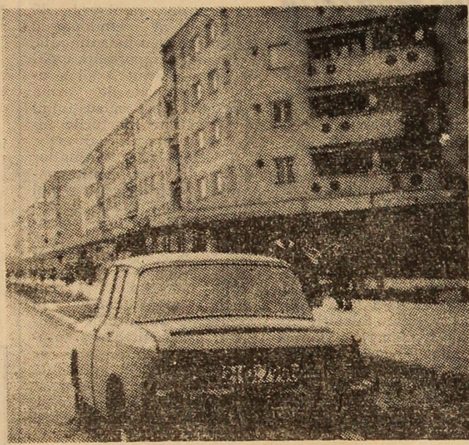
Vulcan. Secvență citadină.