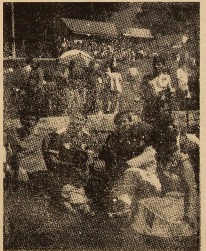
Instantaneu la zona de agrement „Brața” din Lupeni.

cultura din Petroșani în zilele de 26 și 27 august, unul de estradă, iar celălalt cu opera „Mam” zelle Nitouche”, lucrare aparținînd compozitorului francez Florimond Hervé. Biletele s-au pus în vânzare la agenția Casei de cultură.