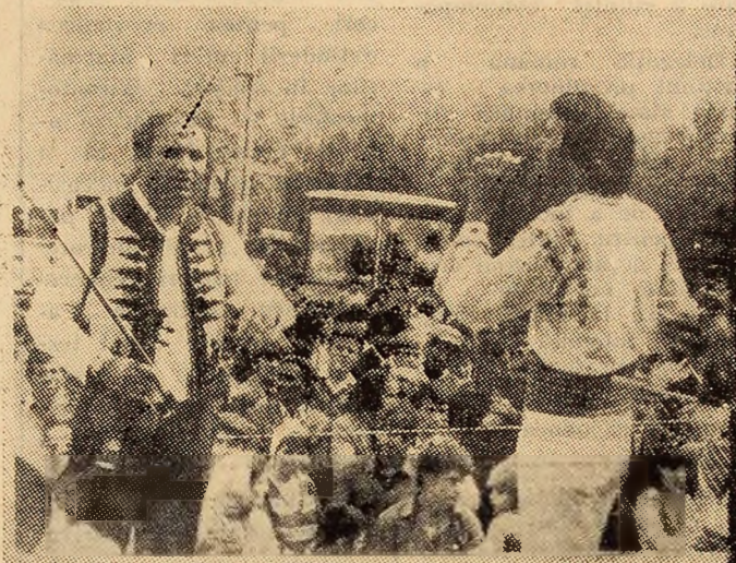
O imagine pe care am vrea să o înfîlmim cît mai des la locurile de agrement, la fiecare sfîrșit de săptămînă.

Aparatele electronice muzicale nu mai sînt de mult o prezență neobișnuită în viața noastră. Raionul specializat pentru discuri și benzi magnetice înregistrate al magazinului „Jiul” pune la