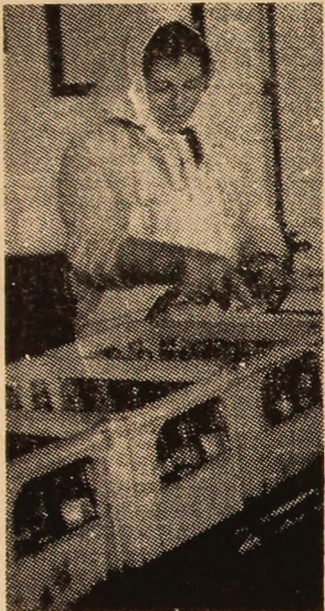
La secția de producție a răcoritoarelor din Livezeni se muncește intens pentru a asigura consumatorilor noi sortimente de produse de sezon.