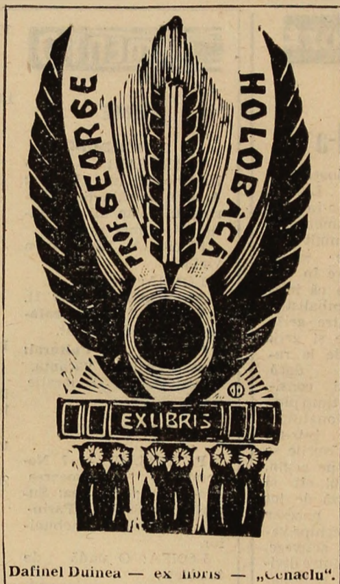
Dafinel Duinea — ex libris — „Cenaclu”.

— Aici HO4, HO4 cheamă LOX... Răspunde LOX. Pilotul întinse mîna și a-