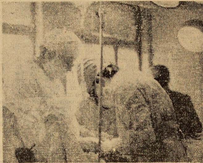
Înaltă profesionalitate, dăruire în slujba ocrotirii vieții și sănătății semenilor — iată o „carte de vizită” nescrisă a „oamenilor în balat alb” de la Spitalul municipal din Petroșani.

Înainte de a ne despărți, tinărul șef de sector ne-a dat o întâlnire adevărată. Anul viitor în cadrul sectorului VIII se va introduce primul complex mecanizat. Vom avea posibilitatea să vorbim, pe la sfîrșitul anului 1986 de cel mai mecanizat și mai mare sector de la mina Vulcan.