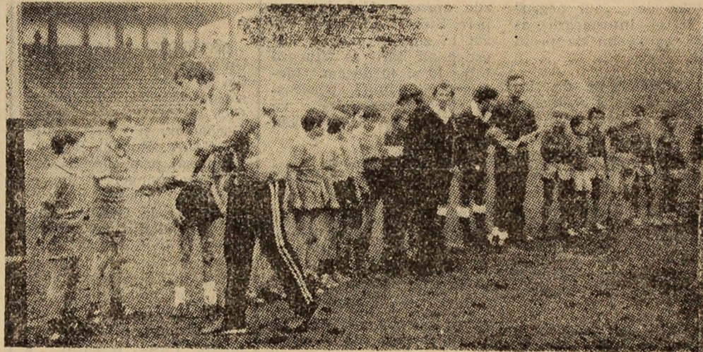
Premiera micilor finaliști...