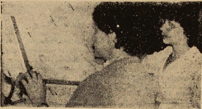
La planșetă, unde prinde contur cercetarea științifică.