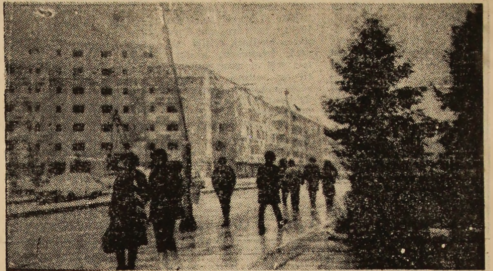
Petroșani Nord la ora... primilor fulgi!

Îată deci că o pirghie importantă în mărirea cantităților de cărbune o constituie creșterea productivității muncii, a randamentelor pe post.