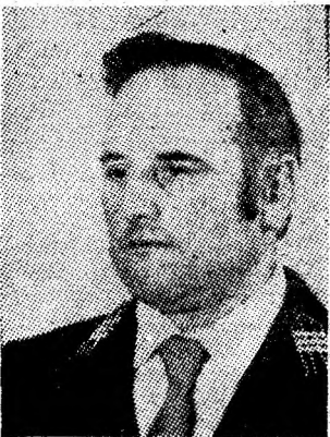
Z O I A D I O N I S I E