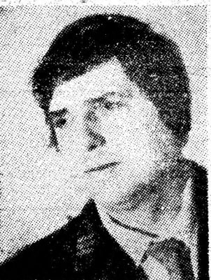
C O N S T A N T I N E N E