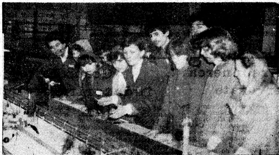
Instruirea tinerilor, procesul de formare a noilor cadre — un imperativ la Tesătoria de mătase din Lupeni.

Cursurile universității pentru anii I, II și III se desfășoară în ziua de luni, 10 martie, ora 16. În Căminul municipal de partid (sala mică a Casei de cultură).