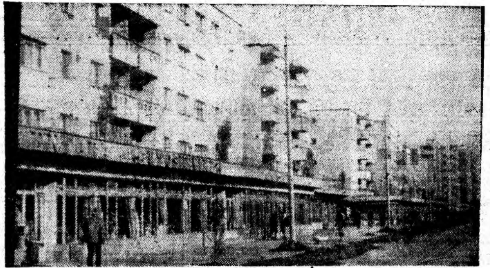
Vulcan. Un oraș cu mii de gospodari, în fața unui nou sezon al hărniciei.