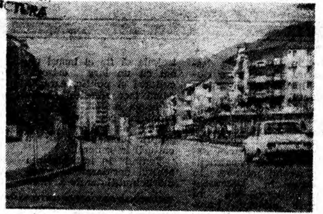
Petroșani-Nord. Un cartier de referință al municipiului.