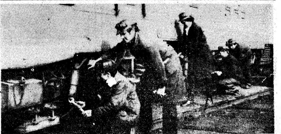
Verificarea locomotivelor Diesel în depoul CFR Petroșani.

teristicile tehnice ale utilajelor asimilate în producție, este faptul că instalațiile respective sînt rodul unei fructuoase colaborări între cercetători și specialiștii din industria minieră și din întreprinderile constructive. Așa se face că ele au randamente sporite și că gradul de siguranță în exploatare este mult mai mare. Fără îndoială că, în felul acesta, se asigură, în subteran, productivități sporite și, prin funcționarea timp îndelungat, fără incidente tehnice, se creează posibilitatea obținerii unor producții superioare de cărbune. Este, acesta, scopul final al activității constructorilor de mașini și al celor care le folosesc în subteran — minerii.