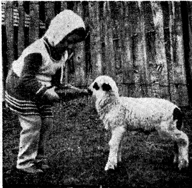
...dacă vrei să crești mare!