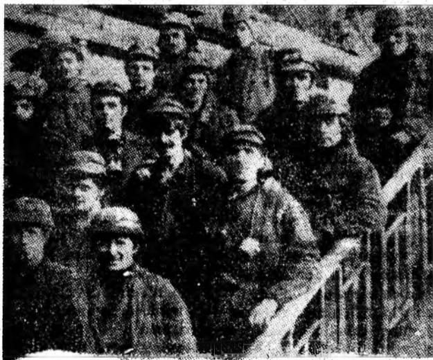
Mineri de la I.M. Lupeni la ieșirea din șut.