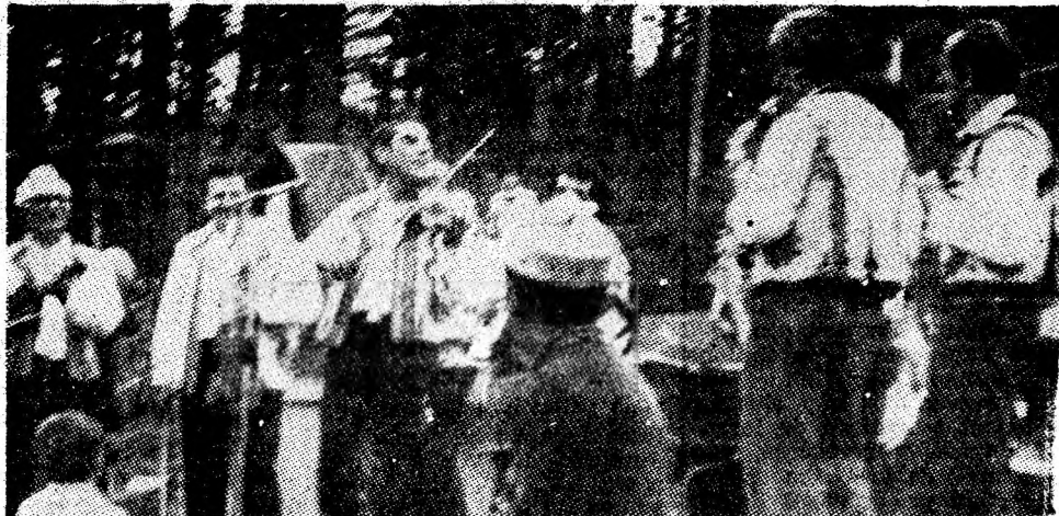
În ziua de 1 Mai, la Brădet, în compania ansamblului folcloric „Paringul”.