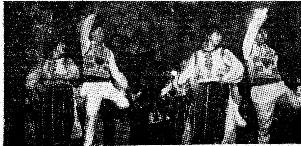
Moment din spectacolul omagial închinat zilei de 1 Mai, desfășurat în sala Teatrului de stat „Valea Jiului” Petroșani, miercuri, 30 aprilie. În imagine, formația de dansuri populare a ansamblului artistic „Paringul”, al Casei de cultură.

● La Petroșani, în zona Brădet, ansamblul folcloric „Paringul” al Casei de