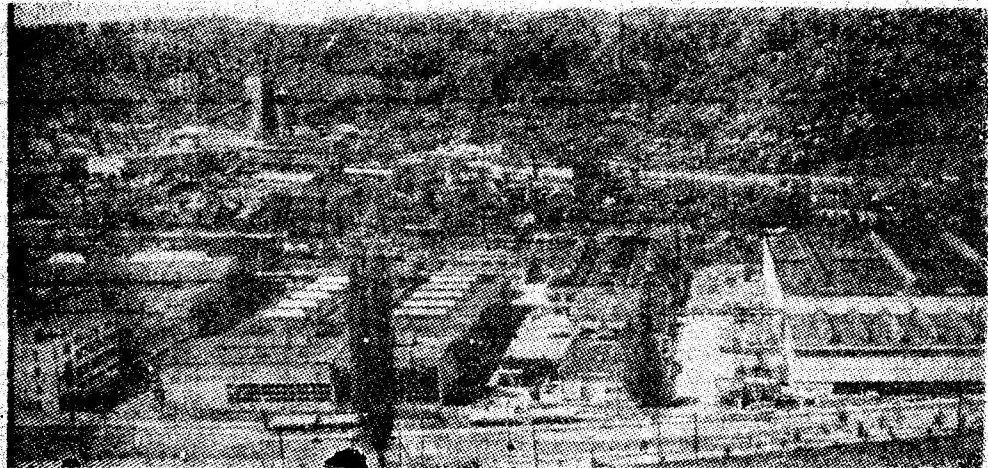
I.U.M.P. O adevărată platformă a industriei construcțiilor de mașini miniere s-a edificat la intrarea în Petroșani.