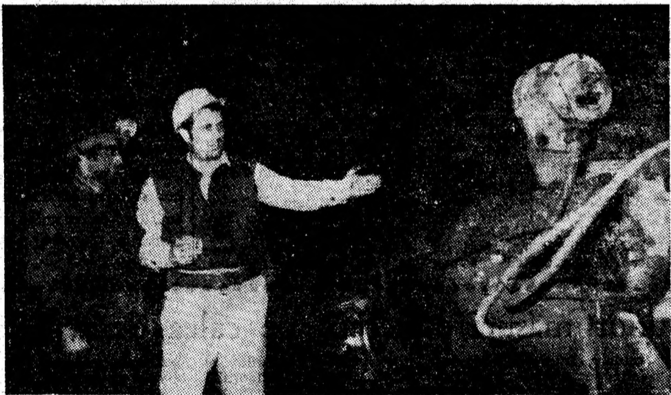
O prezentă, obișnuită — abatajul mecanizat.