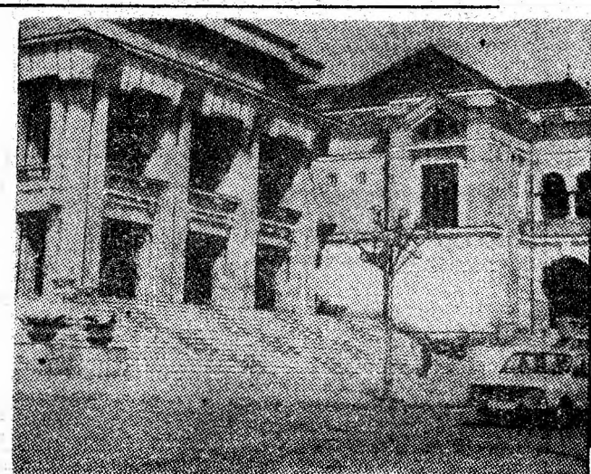
Cu o arhitectură modernă, clădirea Teatrului de Stat „Valea Jiului” se înscrie armonios în peisajul urbanistic al reședinței de municipiu.