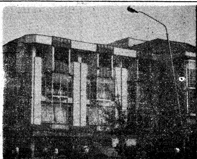
Principala arteră de circulație din Petroșani este dominată de edificiul magazinului universal „Jiul”, vizitat zilnic de mii de cumpărători.