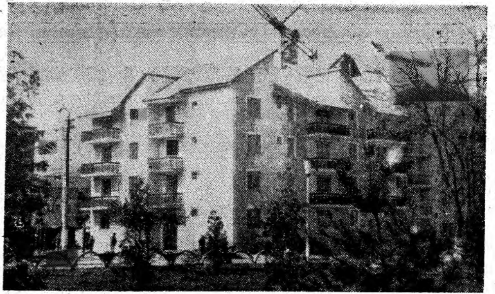
Vulcan — înnoiri editilare.