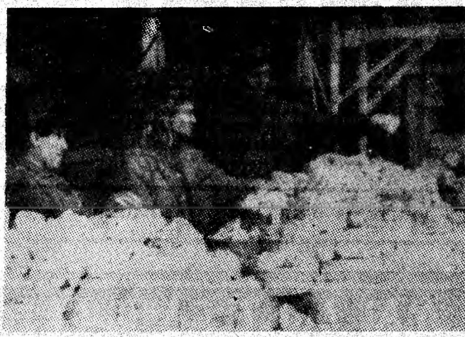
Aspect de muncă de la secția de preparare a cuarțului Uricani.