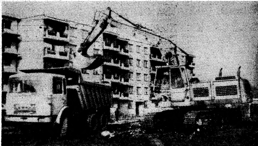
Imagine de muncă a constructorilor, în cartierul Bucura din orașul Uricani.

Ne oprim aici. Concluzionînd că s-au întreprins măsuri prezente și de perspectivă bine gîndite, eficiente, care dau garanția încadrării, și pe mai departe, în indicatorii de calitate a cărbunelui.