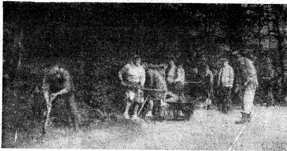
Gospodarii în plină acțiune.