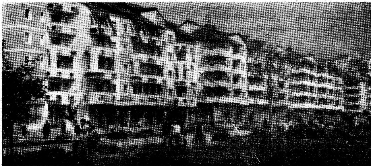
Arhitectură modernă în reședința municipiului.