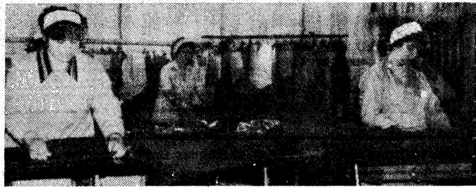
Aspect de muncă din atelierele întreprinderii de tricotaje Petroșani.