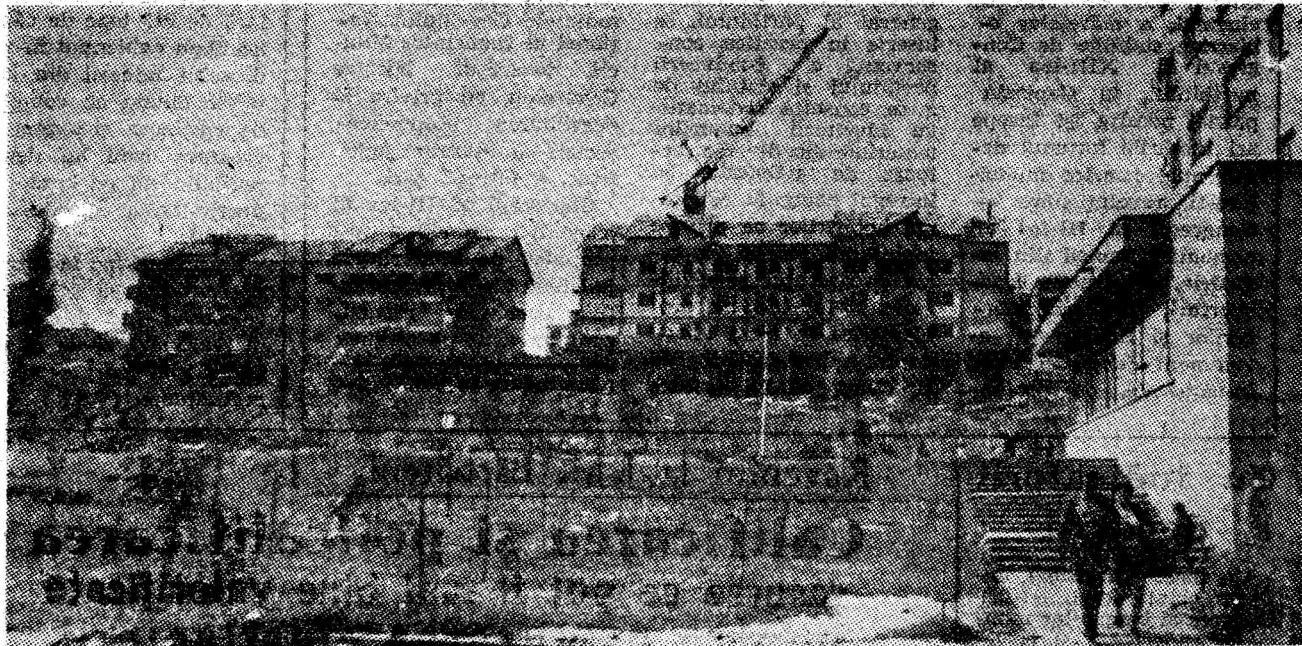
Noi construcții pentru dezvoltarea fondului locativ în Vulcan.

Am surprins, în rîndurile de față, doar un aspect al modului plin de seriozitate cu care este privită, la Paroșeni, activitatea circumscrisă celor 3 R. O activitate a cărei eficiență nu se limitează doar la importante sume de bani incluse în contul economiilor, ci poate fi luată și ca etalon pentru permanentă autodepășire profesională, proprie colectivului din cadrul atelierului electric.