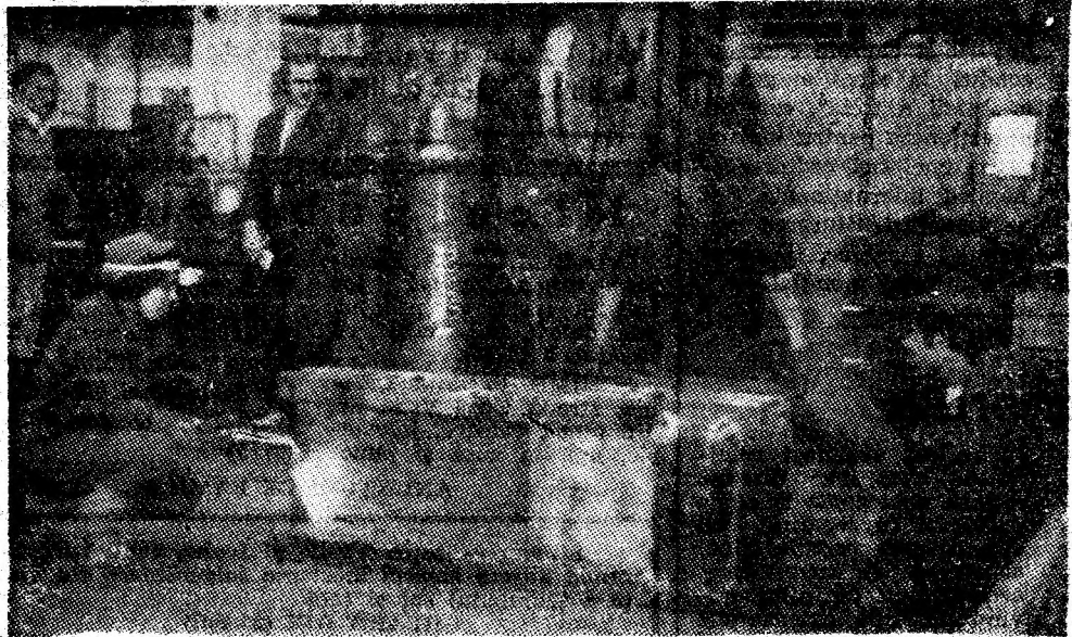
IPSRUEEM. Echipa de „confecții metalice” condusă de Viorel Epure.