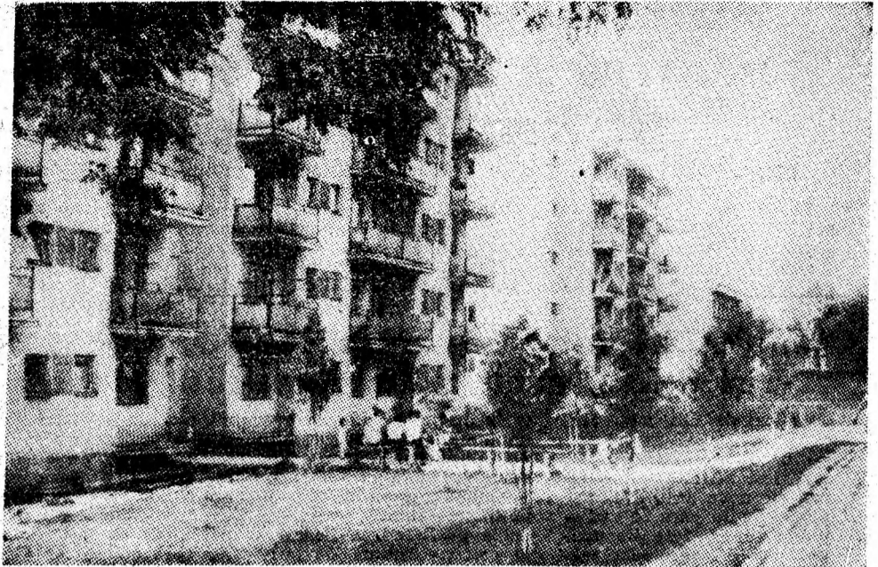
Noile construcții de locuințe pentru mineri dau notă distinctă peisajului citadin din Lonea.