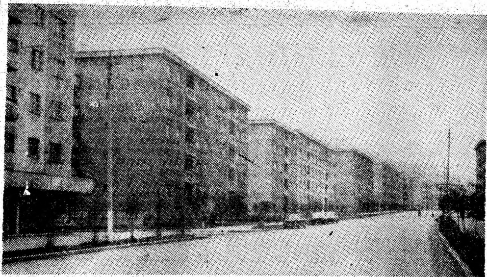
Pe elegantul bulevard al Lupeniului de azi, orașul minerilor își etalază elementele urbanisticii moderne, ale civilizației și calității vieții.