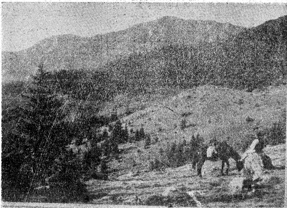
Virful Piule — una dintre marile atracții ale Retezatului Mic. În acest loc al- pin, drumeții au găsit dintotdeauna neuitate clipe de desfățare în mijlocul unei naturi mirifice.