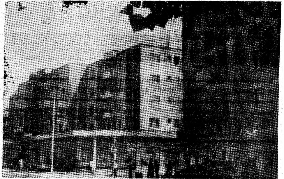
Construcții moderne în Petrița.