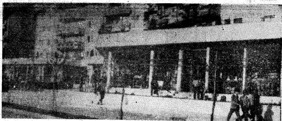
Petroșani Nord. Imagine de toamnă.

ANUL VIII, NR. 10 628 | SIMBĂTĂ, 15 NOIEMBRIE 1986 | 4 PAGINI — 50 BANI