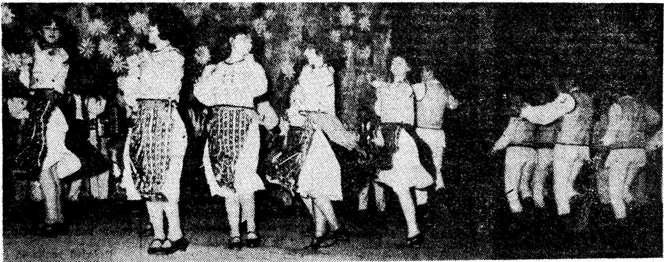
Ansamblul „Parîngul” — un colectiv artistic de prestigiu al Văii Jiului. Cu fiecare nou spectacol, aceste pasionați păstrători ai minunatului nostru tezaur folcloric sînt răsplățiți cu vie aplauze de către marele public.

Sunetul flautului său capătă ceva din căldura tradițiilor culturii minerilor, se împletește cu susurul violonilor, prinde un crîmpei din ritmul pașilor de dans.