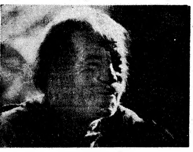
Răbojul anilor.