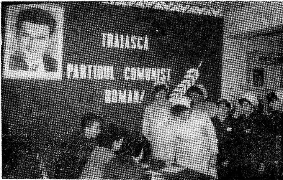
La Întreprinderea de tricotațe Petroșani.

Redăm, în reportajele noastre impresii, gânduri și imagini din timpul referendumului, eveniment politic major desfășurat sub semnul dorinței de pace a tuturor celor ce trăiesc și muncesc în municipiul nostru.