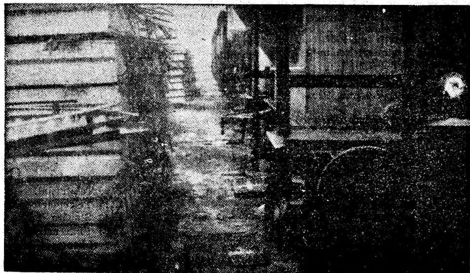
Pe linia de descărcare a IACMM — secția Vulcan — lipsa de gabarit și cea de gospodărire merg „mină în mină”. Dovada? Aceste planșuri descărcate la nici un metru de vagoanele aflate pe linie.