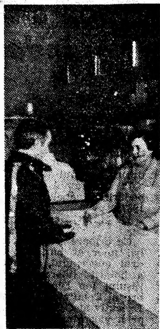
Unitatea nr. 199 cosmetice se bucură de bune aprecieri, în cadrul I.C.S. Mixtă Vulcan.