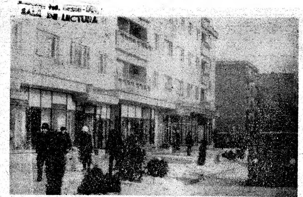
Cele mai recente construcții edilitare finalizate în cartierul Bucura — Urșani.

cativă strădaniile consacrate pentru creșterea în rândul cadrelor de specialiști, a colectivelor de muncă a unui climat optim, propice desfășurării unei activități tehnico-productive de calitate în producție. În conformitate cu prevederile programului, în tot cursul a-