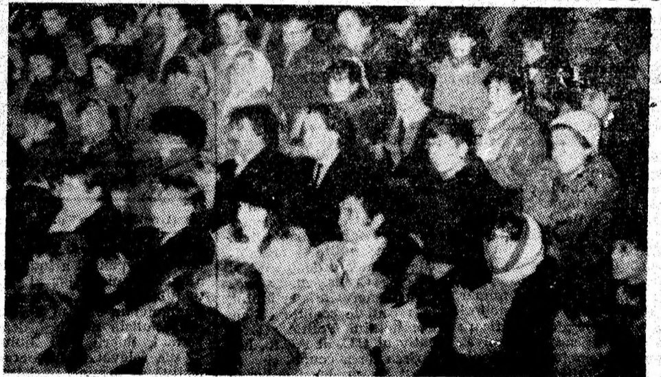
Aspect din adunarea festivă a tineretului.