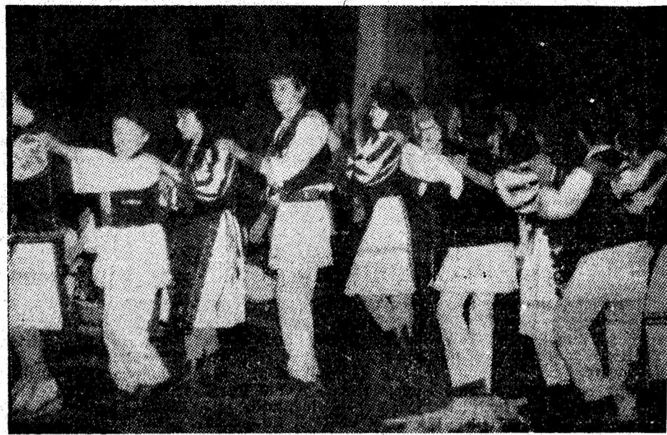
Folclor momirlănesc, pe scena Festivalului național „Cântarea României”.

adus, totodată, la descoperirea a numeroase urme de locuire postromană — un sistem de canale de drenaj, construite în piatră de riu și datate între secolele III și VII—VIII e.n. Au fost identificate, de asemenea, materiale arheologice de o mare diversitate — ceramică de uz comun — oapețe, monede, fibule de bronz, obiecte de fier, fragmente de vase de sticlă ș.a. (Agerpres)