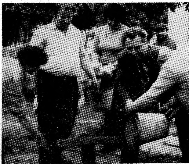
In Vulcan, pe alea Crizantemelor, cetățenii participă la acțiunile de muncă patriotică, avînd ca scop montarea unor noi conducte de apă caldă și agent termic.

— Pe întreprindere, vom ridica nivelul mediu al realizărilor zilnice. Dacă, în mai, acesta era de 1800 tone, vom ajunge, în prima decadă din iunie, la 2100 tone de cărbune, urmînd ca, în continuare, să-l situăm la 2300 tone. În modul acesta vom căuta să îndeplinim sarcinile stabilite la recentă analiză efectuată la nivelul CMVJ.