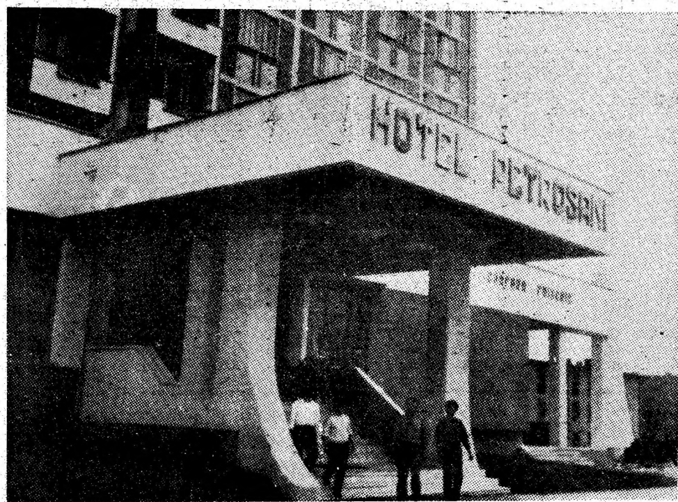
Hoteul Petroșani, o gazdă primitoare pentru oaspeți.

Un locuitor din Lonea, strada 6 August, bloc 7, ap. 11