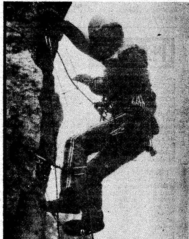
La antrenament in Cheile Tăii.