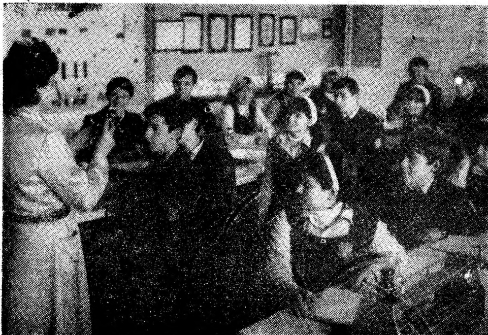
Învățămîntul, baza sa materială au cunoscut, în anii socialismului, prefaceri fără precedent.