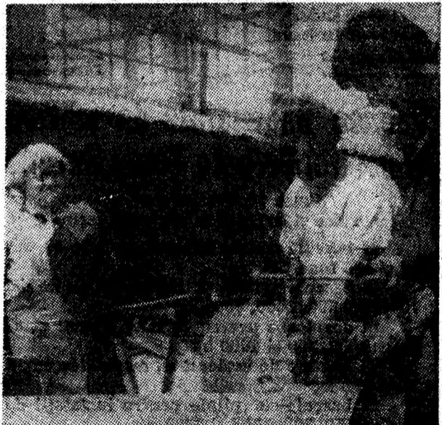
În atelierul I.M. Lonea se execută o serie de confecții metalice necesare activității din subteran.