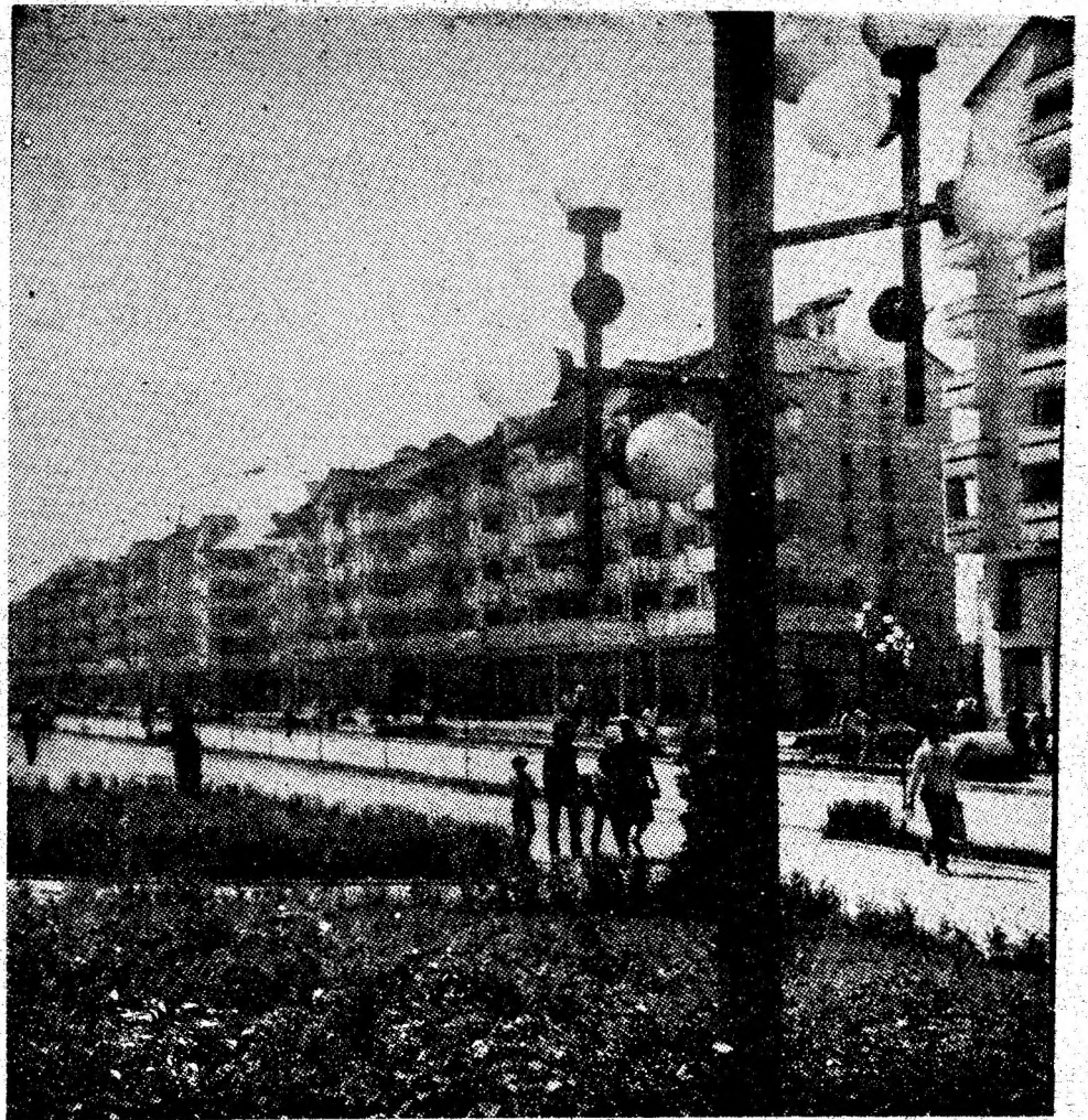
Arhitectonică elegantă, ce îmbină elementele tradiționale cu cele moderne, te întâmpină azi în reședința de municipiu.