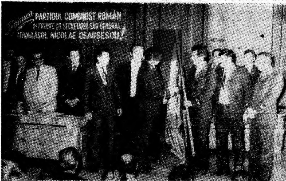
În cadrul adunării festive dedicate Zilei minerului, se înmîncează „Drapelul de întreprindere minieră fruntașă”, pe semestrul I, și „Diploma de onoare” colectivului I.M. Lonea.

În luna august avem de realizat la producția de huiă brută cu 140 000 de tone mai mult decît în luna iulie. Este o sarcină care trebuie să determine o mai temeinică analiză, o mai puternică mobilizare a tuturor colectivelor miniere pentru creșterea producției de cărbune extras, pentru îndeplinirea integrală și ritmică a sarcinilor planificate.