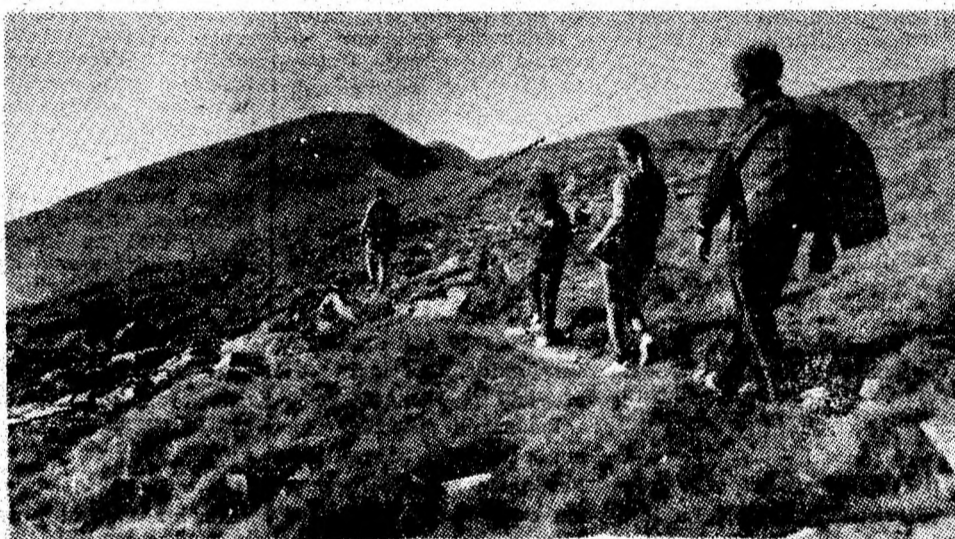
„Drumeție în Parîng”.

„A fost nevoie să intervenim pentru a opri afliuxul neașteptat de mare al donatorilor din colectivul nostru la Laboratorul de recoltare și conservare a singelui, primindu-se de acolo chiar un apel telefonic în acest sens — își continuă interlocutorul emoționantă relatare. Pe oricare dintre ei îi întrebai de ce oferă picătura sa de sînge în serviciul supremului scop umanitar, răspunsul era invariabil același: oricare, în locul meu, ar fi procedat la fel cînd este în joc salvarea unei vieți de om.”