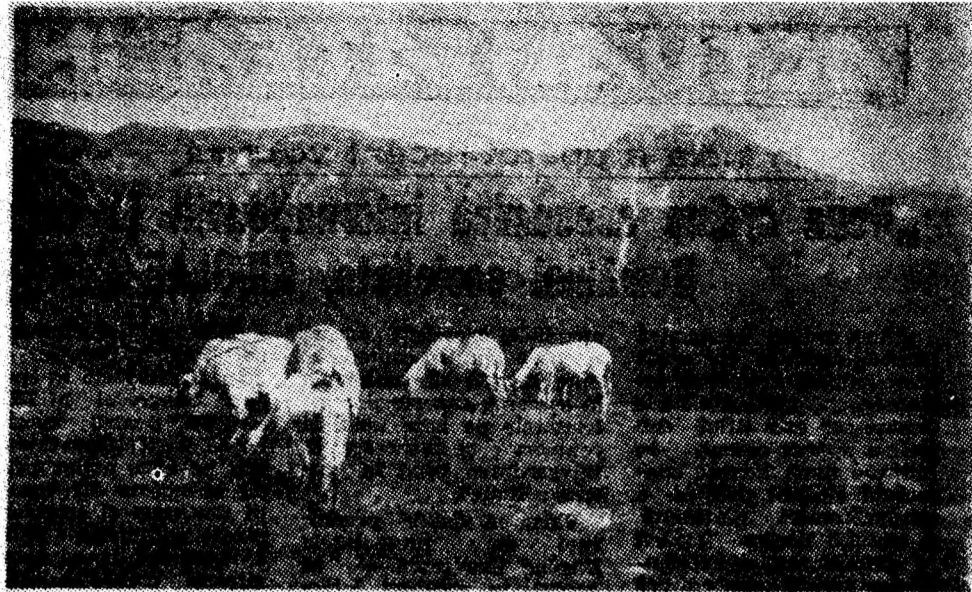
„Pe un picior de plai...”