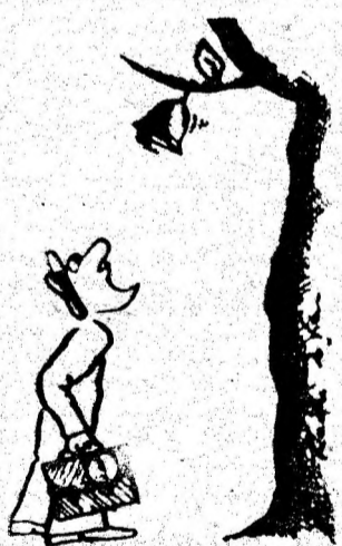
Desen de Radu IATCU