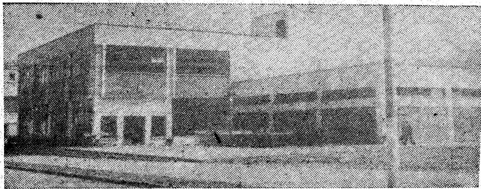
Noua hală agroalimentară, situată în centrul civic al orașului Lupeni.

O altă măsură ține de cazarea în cămin, unde și aici s-a ținut cont, pe cît a fost posibil, de dorințele tinerilor. „Nu înseamnă că nu sînt dificultăți. Cantina de la căminul 10 este total depășită — ne spune interlocutorul. Ne convingem la fața locului. În momentul de față microcantina dispune de 18 mese a 4 locuri fiecare, ceea ce face ca, servindu-se masa tinerilor din cămin, în două serii, să poată mânca doar 128 de oameni. Or, în prezent servesc masa