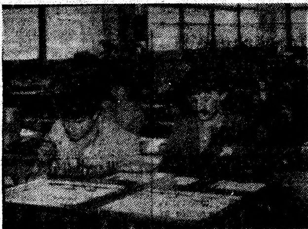
Aspect din secția automatizării a IUMP.

— Absențele nemotivate. Acest lucru a diminuat numărul de posturi în cărbune. Două exemple: în 1 și 3 decembrie, s-au prestat 311 și, respectiv, 318 posturi, față de 372 posturi în noiembrie. Altele motive, în afară de „săriturile” din sectorul IB, nu sînt. Sînt convins că, lucrînd cu aceeași oameni cu care, în luna trecută, am realizat planul, în zece zile vom recupera integral restanța pentru ca, și la încheierea ultimei luni a anului, să ne realizăm sarcina la producția de cărbune.