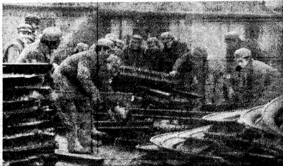
Colectivul sectorului IV, în primele rînduri ale acțiunii gospodărești de la I.M. Uricani.