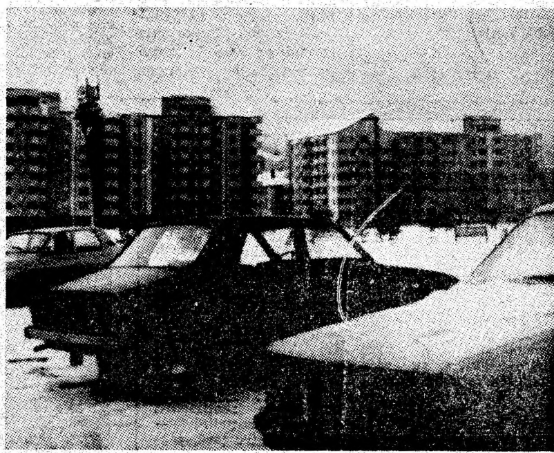
Petroșani — 1987: Mărturiile ale impresionantelor împliniri edilitare din reședința municipiului.