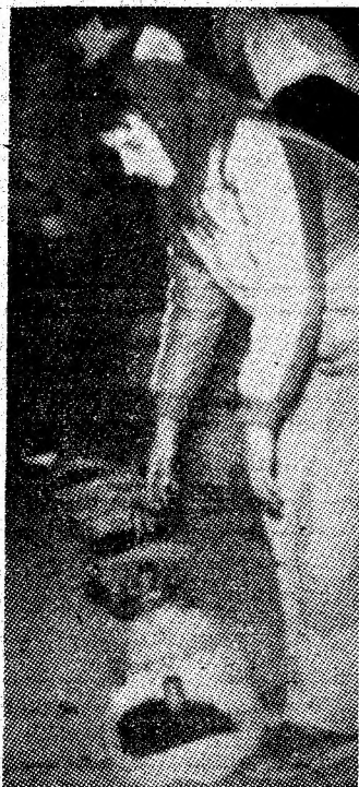
Aparatul fotografic a fost mai rapid, vînzătoarea ambulantă n-a mai avut timp să-și strîngă „marfa”.

„Paringul” la film, cu buzunarele pline cu semințe, cumpărate de la „vînzătoarele ambulante”, aflate în fața cinematografului (foto 1) și pe care nimeni nu le întreabă ce caută acolo. Mîncîcă liniștit, deranjîndu-i pe ceilalți spectatori cu zgomotul iritant al semințelor sparte între dinți și aruncate pe jos. Il invităm la o discuție. Nu deschide nici măcar gura, să spună ceva. Pleacă ochii și atît. Aceeași a-