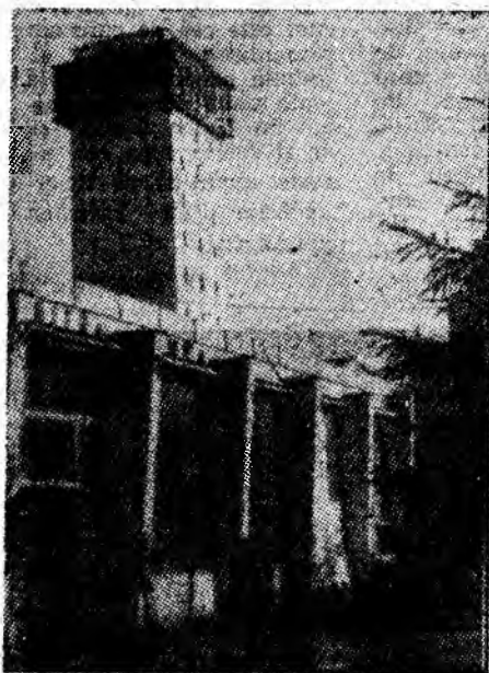
I.M. Lonea — vedere spre puțul de extracție.