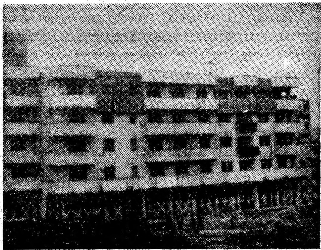
Unul dintre blocurile recent date în folosință în cartierul Tudor Vladimirescu din Lupeni.