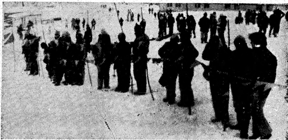
Asistență numeroasă, la linia de sositre.

Comitetul sindicatului și asociația sportivă a IGCL Petroșani, beneficiind de sprijinul corpului de arbitri, au asigurat bune condiții de organizare. Iată de ce la startul actualei ediții a „Cupei Telescaun“ s-au aliniat 150 de concurenți de toate vîrstele, ceea ce reprezintă un adevărat record de participare. Stratul de zăpadă proaspătă a asigurat, de asemenea, condiții optime de desfășurare a întrecerii, care a avut loc pe pârțile din poienița de lângă baza didactică a