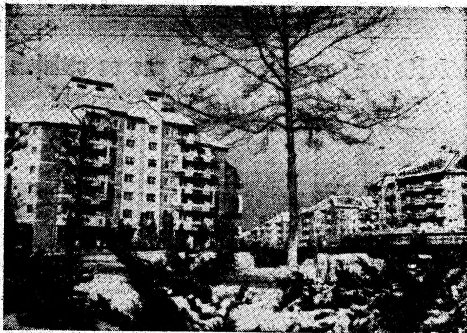
Secvență din reședința de municipiu.